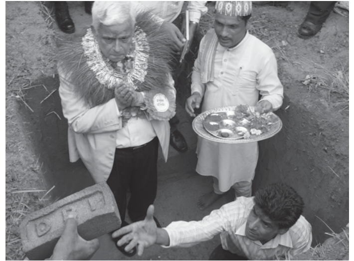
पृथ्वीनगरमा सहकारी चिया कारखानाको शिलान्यास गर्दै उपप्रधान तथा अर्थमन्त्री

भाताको कार्यक्रम ल्याएको तपाईंहरूले बिर्सनु भएको छैन होला । अब हामी देशमा उत्पादन बढाउनेतर्फ नलागी नहुने भएको छ । हामीले भारतबाट